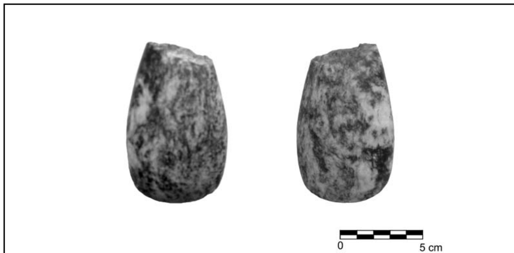
Figura 2.2. Hacha pulimentada.