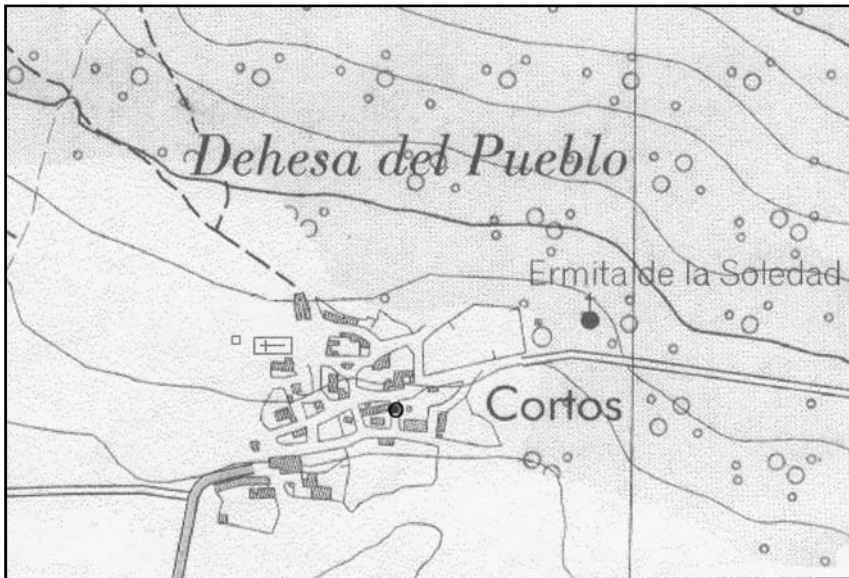
Figura 1.2. Plano del casco urbano de Cortos con el lugar de aparición de la pieza.