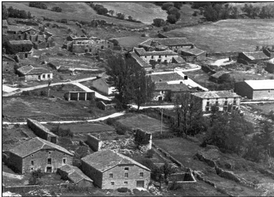
Figura 2.1. Fotografía del pueblo con indicación del punto del hallazgo.