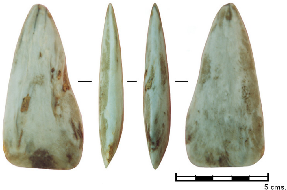
Figura 3. Distintas perspectivas de la pieza.

Final y Eneolítico (TARACENA, 1941: 68-69). Sobre estos hallazgos incidiremos más adelante.