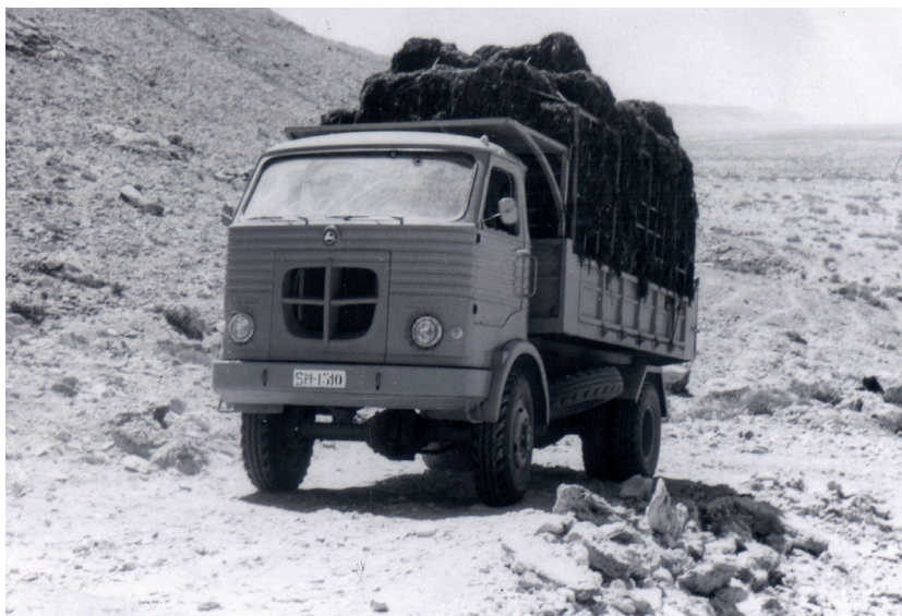
Figura 1. Camión transportando algas.