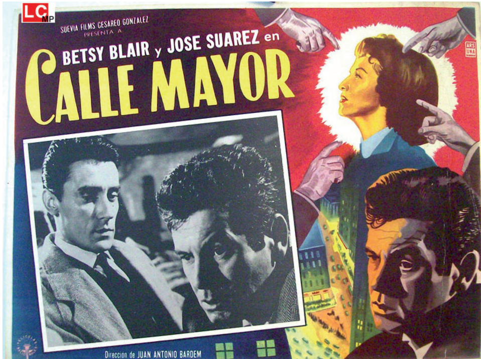
Lámina 4. Cartel de la película Calle Mayor.