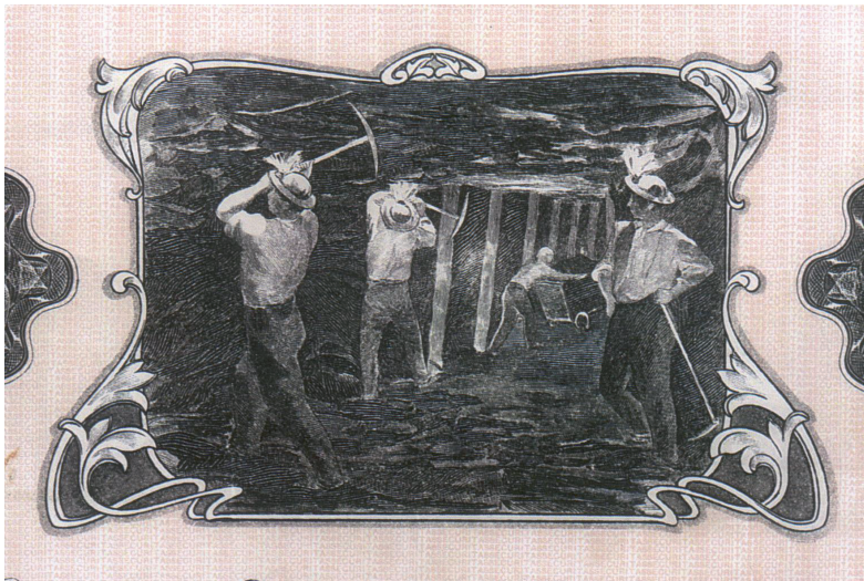
Lámina 5. Detalle de la acción de las Hulleras de San Martino, Pola de Lena Asturias, 1906. Las acciones de las compañías mineras asturianas son otra fuente de estudio privilegiada para profundizar la estética y usos laborales de la minería asturiana.

Nuestras dos sociedades mineras más decanas prosiguen su programa paternalista decimonónico en términos de vivienda obrera y, sobre todo, en cuanto a la habilitación de unidades escolares en las áreas más densamente pobladas. Auspiciadas por el Plan Nacional de la Vivienda se levantan las colominas de Oyanco dentro de un programa denominado de «mejora del habitat [sic] minero». 30 Las actas se hacen eco de estas cuestiones, 31 y en la sesión del día 19 de octubre de 1955 se aprueba «la construcción de dos unitarias y una de parvulos [sic] en el nuevo poblado de Oyanco y con cargo a la Sociedad Industrial (...)». La misma compañía vuelve a ser objeto de referencia el 6 de junio de 1962, cuando se pretende «graduar la enseñanza en Oyanco y edificar un grupo pues las escuelas están funcionando en locales habilitados al objeto. La Sra. Inspectora cuenta con el apoyo economico [sic] de la Sociedad Industrial a este objeto».