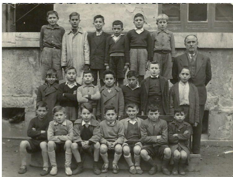
Lámina 7. Escuela Graduada de Cabañaquinta, capital del Concejo de Aller. Alumnos de segundo grado, 1955.

Al profundizar nuestra argumentación dentro del prisma actual, los profesores son ahora los encargados de transmitir a sus alumnos los conocimientos y saberes programados por niveles en el currículo escolar. Muy al contrario, la metodología propuesta por la dictadura franquista se afianzaba sobre criterios meramente memorísticos, sustentados sobre la repetición y la reiteración de unos conceptos vacuos y simplistas. De esta manera, la mayor parte de los estudiantes apenas progresaban en el sentido intelectual, quedando sus conocimientos estancados de un nivel a otro. El régimen se aseguraba así un alumnado disciplinado, acrítico, servil y profundamente ignorante en términos intelectuales, y eso a pesar de su alfabetización funcional que se prodigaba a la masa escolarizada.