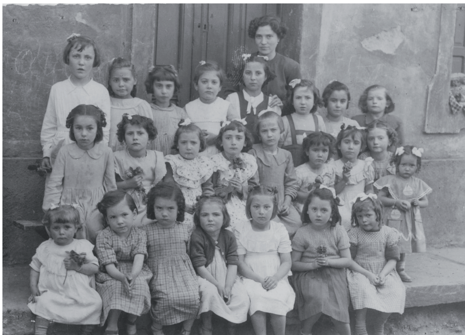
Lámina 8 Escuela de niñas de Agüeria, Aller, 1952.

Fuente: Memoria digital de Asturias, Archivo en red facilitado por el Gobierno del Principado y accesible en la página www.asturias.es [Consulta: 22/03/2015].