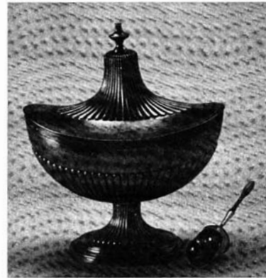
O açúcar e o Quotidiano.