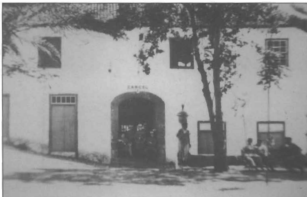
Lámina 4: Fotografía antigua del convento de las Catalinas, convertido en cárcel, desde la Plaza de Santo Domingo, Santa Cruz de La Palma.