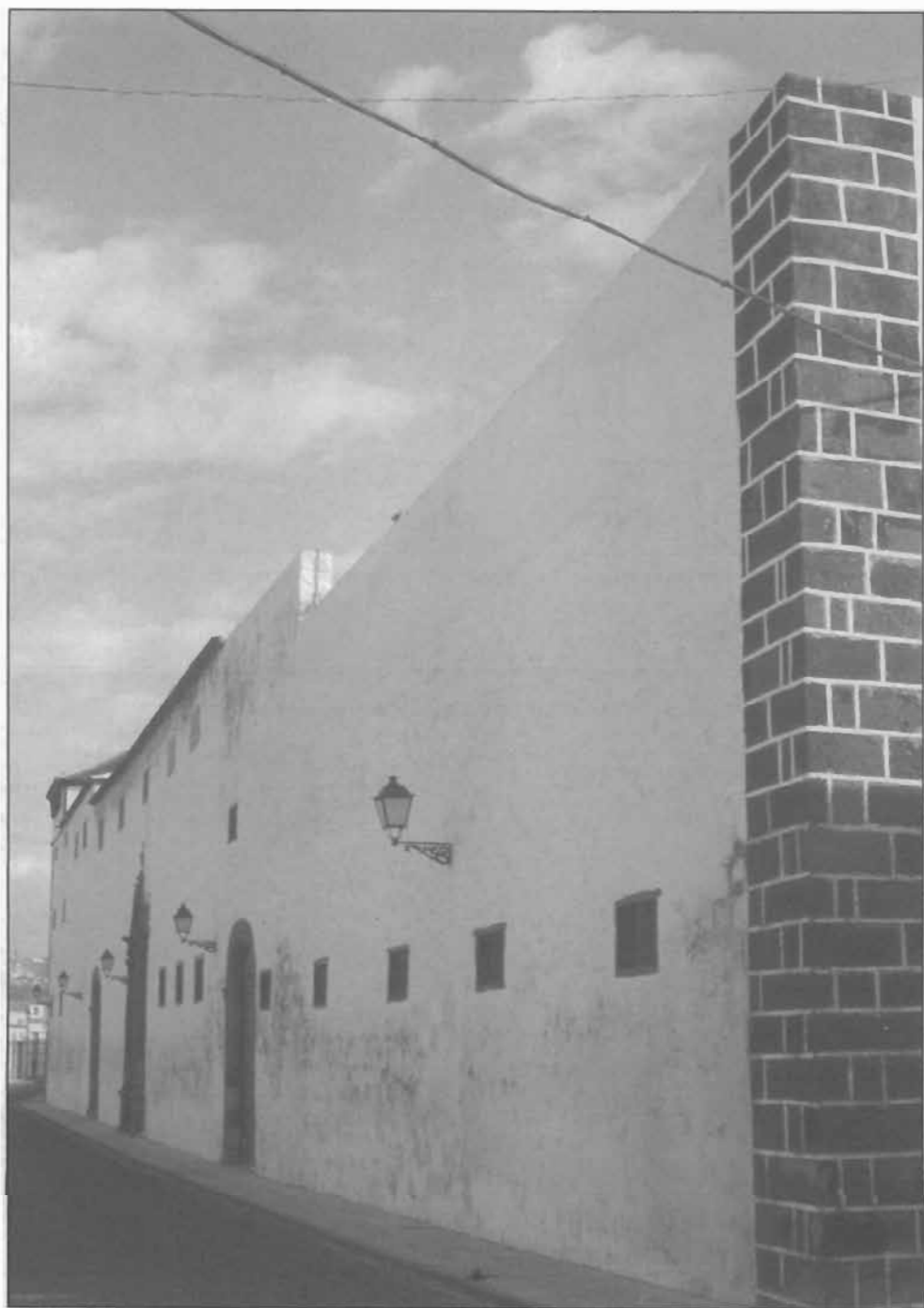
Lámina 11: Convento de las Concepcionistas, Garachico (Tenerife).