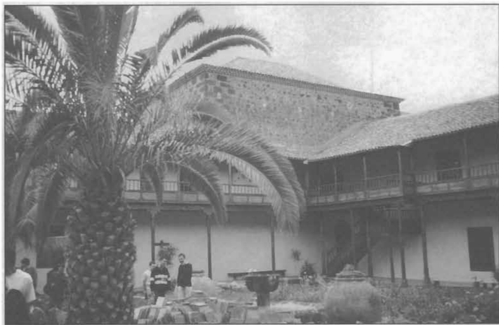
Lámina 7: Claustro del Convento de Santa Clara, La Laguna (Tenerife).