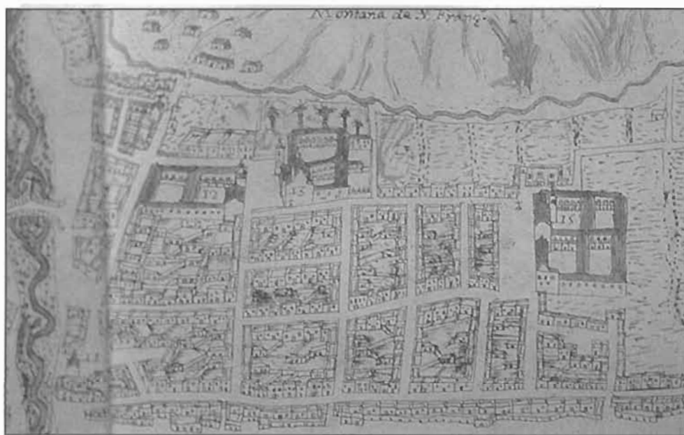
Lámina 2: Plano de Las Palmas de Gran Canaria por Pedro Agustín del Castillo (1686). Detalle del barrio de Triana con los conventos femeninos de Santa Clara y San Bernardo