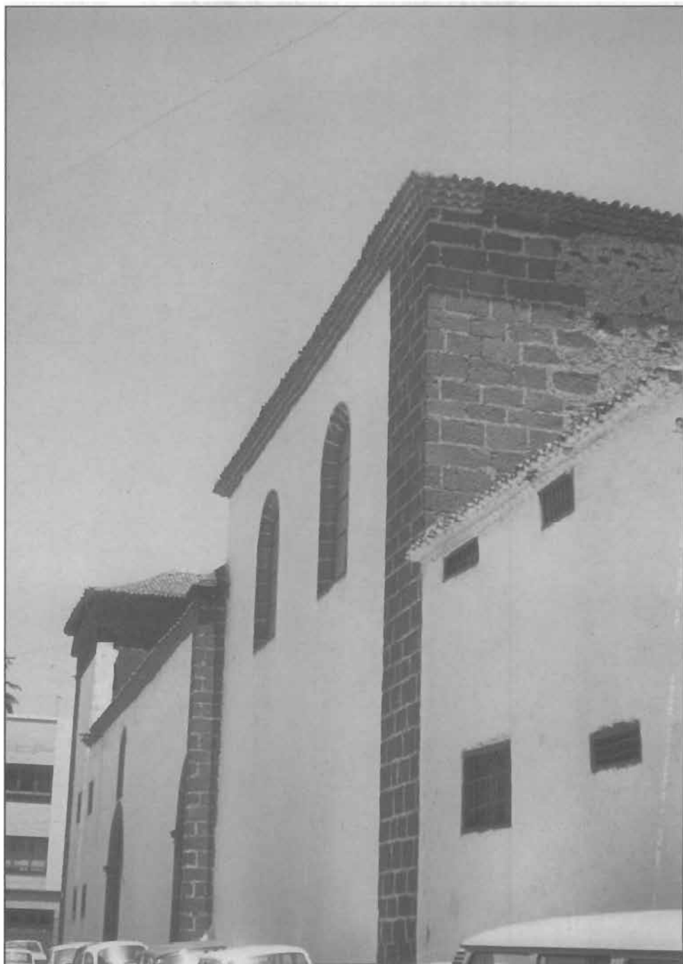
Lámina 5: Iglesia del Convento de Santa Clara, La Laguna (Tenerife).