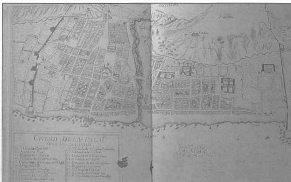
Lámina 1: Plano de Las Palmas de Gran Canaria por Pedro Agustín del Castillo (1686) con los conventos del siglo XVII.