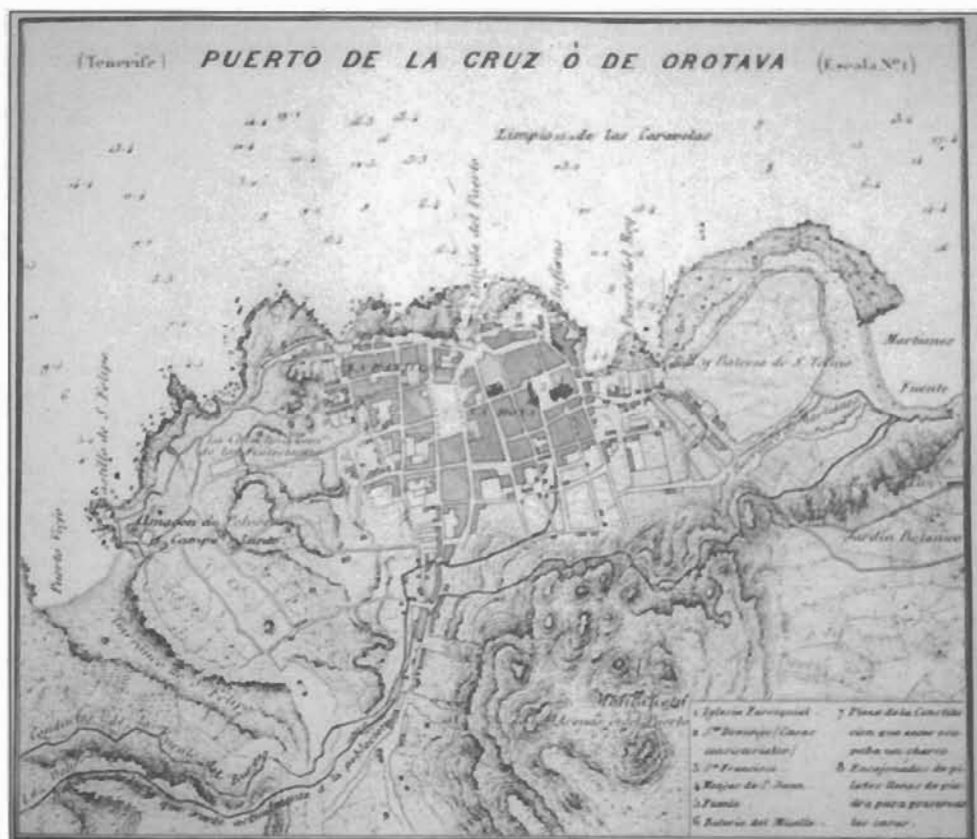
Lámina 13: Plano de Puerto de la Cruz (Tenerife) por Francisco Coello (siglo XIX), con el convento de las Dominicas.