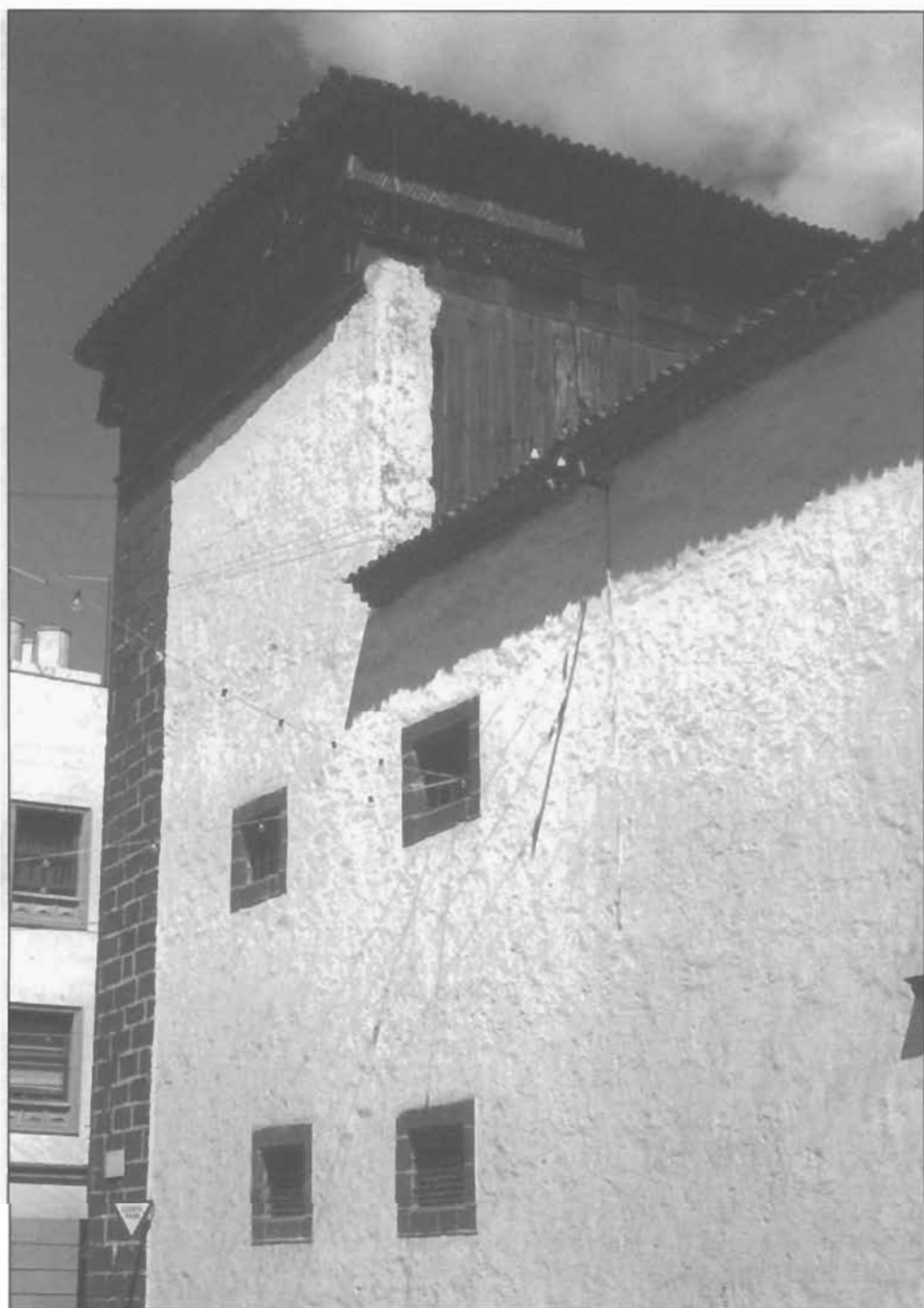
Lámina 6: Mirador-ajimez del Convento de Santa Clara, La Laguna (Tenerife).