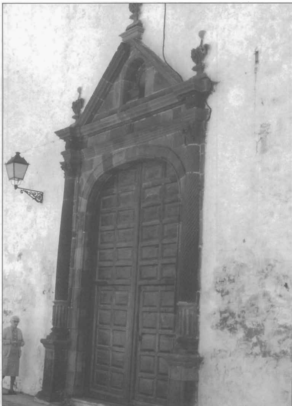
Lámina 12: Portada principal de la Iglesia del Convento de las Concepcionistas, Garachico (Tenerife).