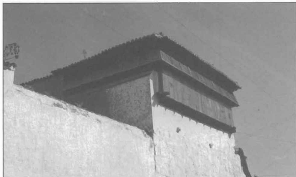
Lámina 9: Mirador-ajimez de Santa Catalina, hacia la Calle de la Carrera, La Laguna (Tenerife).