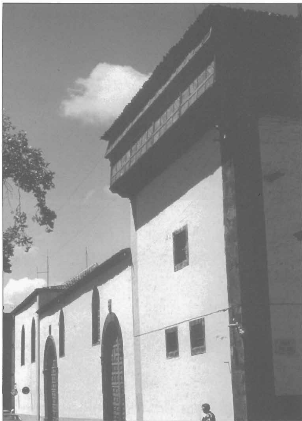
Lámina 8: Iglesia y mirador-ajimez del convento de Santa Catalina, hacia la Plaza del Adelantado, La Laguna.