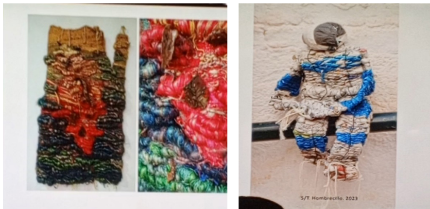
Fig. 3: Algunas obras artísticas del artista guineoecuatoriano Pocho Guimarães.