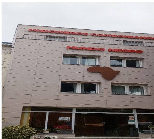
Fig. 1: La sede de Mundo Negro , Madrid.

Esta parte trata de las condiciones en las que viven los miembros la diáspora de en Madrid, mostrando las diferentes asociaciones y sus metas. Luego, destacamos las dificultades a las que se enfrenten y las perspectivas que se les ofrecen.