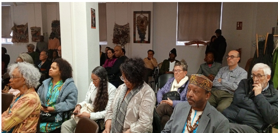
Fig. 2: Algunos miembros de la diáspora guineoecuatoriana en Madrid.