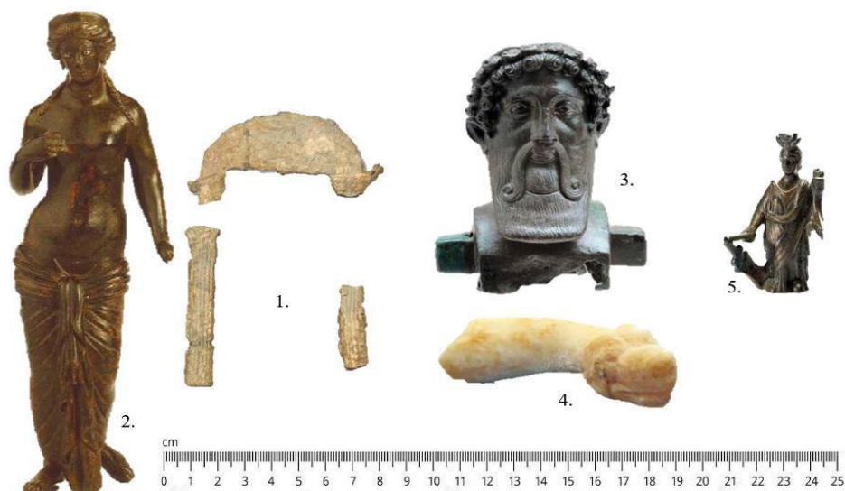
Figura 5. Testimonios de culto doméstico en el Ebro Medio. 1. Naikos de plomo de Los Bañales (ANDREU PINTADO, 2024: 202, fig. 4); 2. Venus de Herramélluri (Museo de La Rioja); 3. Efigie de Baco de Calahorra (TUDANCA CASERO y LÓPEZ DE CALLE CÁMARA, 2014: 244); 4. Serpiente de alabastro de Celsa (BELTRÁN LORIS y MOSTALAC CARRILLO, 2023, 151, fig. 5.95); y 5. Isis-Fortuna de Forua (FERNÁNDEZ PALACIO y UNZUETA PORTILLAS, 2021: 155).

relacionado con la decoración de espacios de culto doméstico como el encontrado en el peristilo de la Casa 2a de Ampurias (Cataluña) donde se representaron en tres de sus caras dos serpientes afrontadas en acercándose al altar con ofrendas, muy similares a otras aparecidas en el entorno del Vesubio (PÉREZ RUIZ, 2007-2008: 211, nota 46).