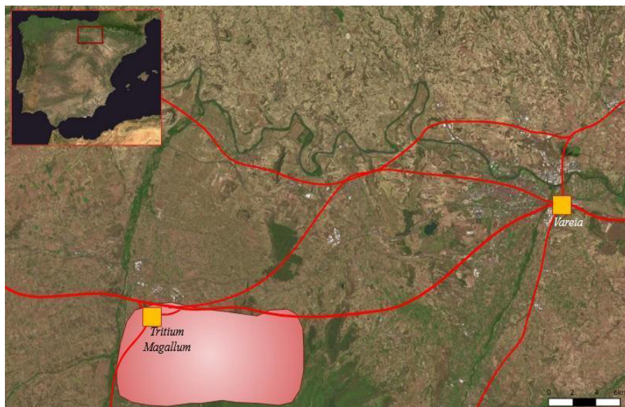
Figura 1. El complejo de Triticum Magallum en relación con las vías de comunicación (Elaboración propia-SIGNA).

Dentro de la heterogénea producción de las diferentes industrias alfareras que se desarrollaron en el bajo Najerilla, especialmente en el entorno de Tricio, se pueden rastrear ejemplos de elaboración de elementos que pudieron tener una relación con el culto doméstico. Pese a que la totalidad son terracotas, se desconoce si los moldes fueron empleados para realizar elaboraciones como se hacía el producto más reconocible de estos talleres: la terra sigillata hispánica. Sin embargo, todos los fragmentos de pequeñas figuras encontradas sí que fueron hechas así.