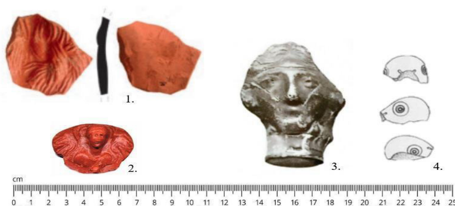
Figura 4. Otros elementos figurados hechos en sigillata . 1. Fragmento con vestiduras traseras femeninas de Emerita Augusta (BUSTAMANTE ÁLVAREZ, 2016: 167, fig. 8.3); 2. Amuleto propiciatorio con representación de Victoria (Velilla de Aracanta, Agoncillo, La Rioja) (PAVIA LAGUNA, 2001: 141, fig. 2) ; 3. Cabeza femenina de Veleia (NIETO GALLO, 1958: lám. 59.2); y 4. Dibujo de fragmento de cabeza de ave de Numancia (ROMERO CARNICERO, 1985: 421, fig. 89.922).

su procedencia exacta, no descartando la tritiense. Se conservan las vestiduras traseras de una figura femenina datada a finales del siglo I (BUSTAMANTE ÁLVAREZ, 2013: 181-182 y 504, lám. 164) (Fig. 4.1). Procede del suburbio norte, un sector que en época romana albergó una zona funeraria (HERAS MORA y OLMEDO GRAGERA, 2010: 45-47) pero también hubo entornos productivos o zonas de vertidos de escombros producidos en obras de monumentalización de espacios domésticos, zonas públicas, etc. lo que hace complicado poder rastrear dónde estaba en origen esta manufactura y su funcionalidad (HERAS MORA et al. , 2011: 349-252).