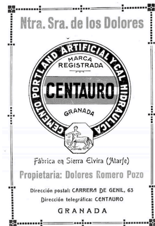
Figura 2. Anuncio de la cementera Ntra. Sra. de los Dolores. Fuente: Granada Gráfica , enero de 1928.